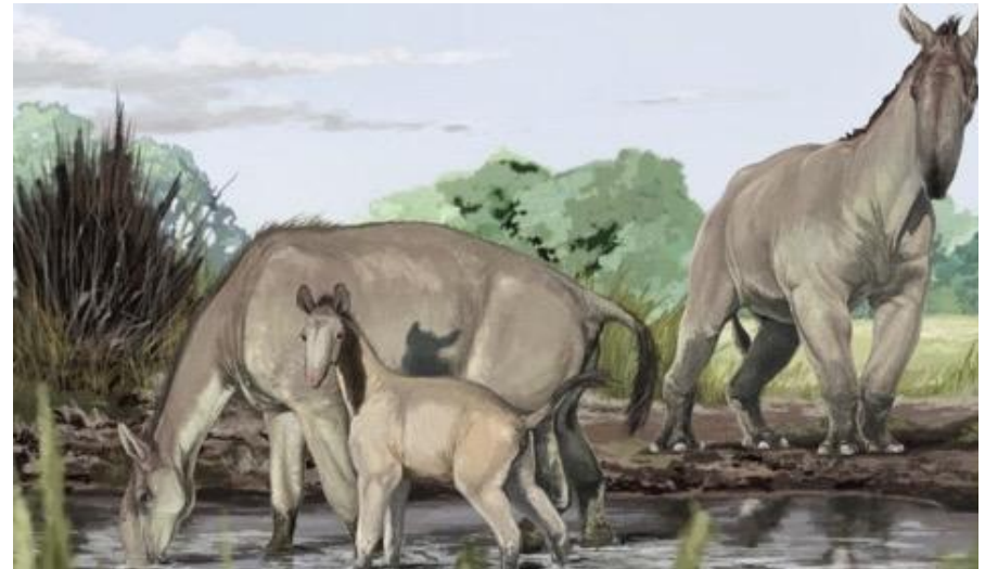
Macrauchenia, pueden visitarse sus restos en el Museo de La Plata o el Museo Paleontológico Municipal "Legado del Salado".

El caudal perenne es alimentado por aguas subterráneas.